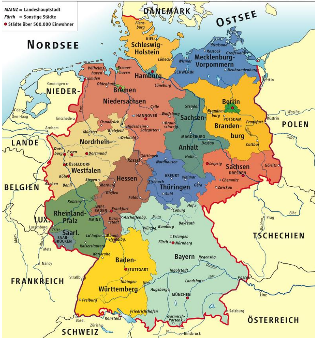
Urheber: kgberger - Eigenes Werk (own drawing), CC BY 2.5, https://commons.wikimedia.org/w/index.php?curid=2586988