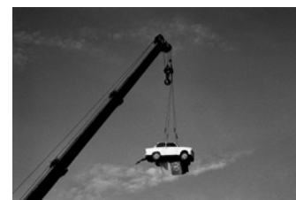
Berlin, 2.10.1990, Potsdamer Platz