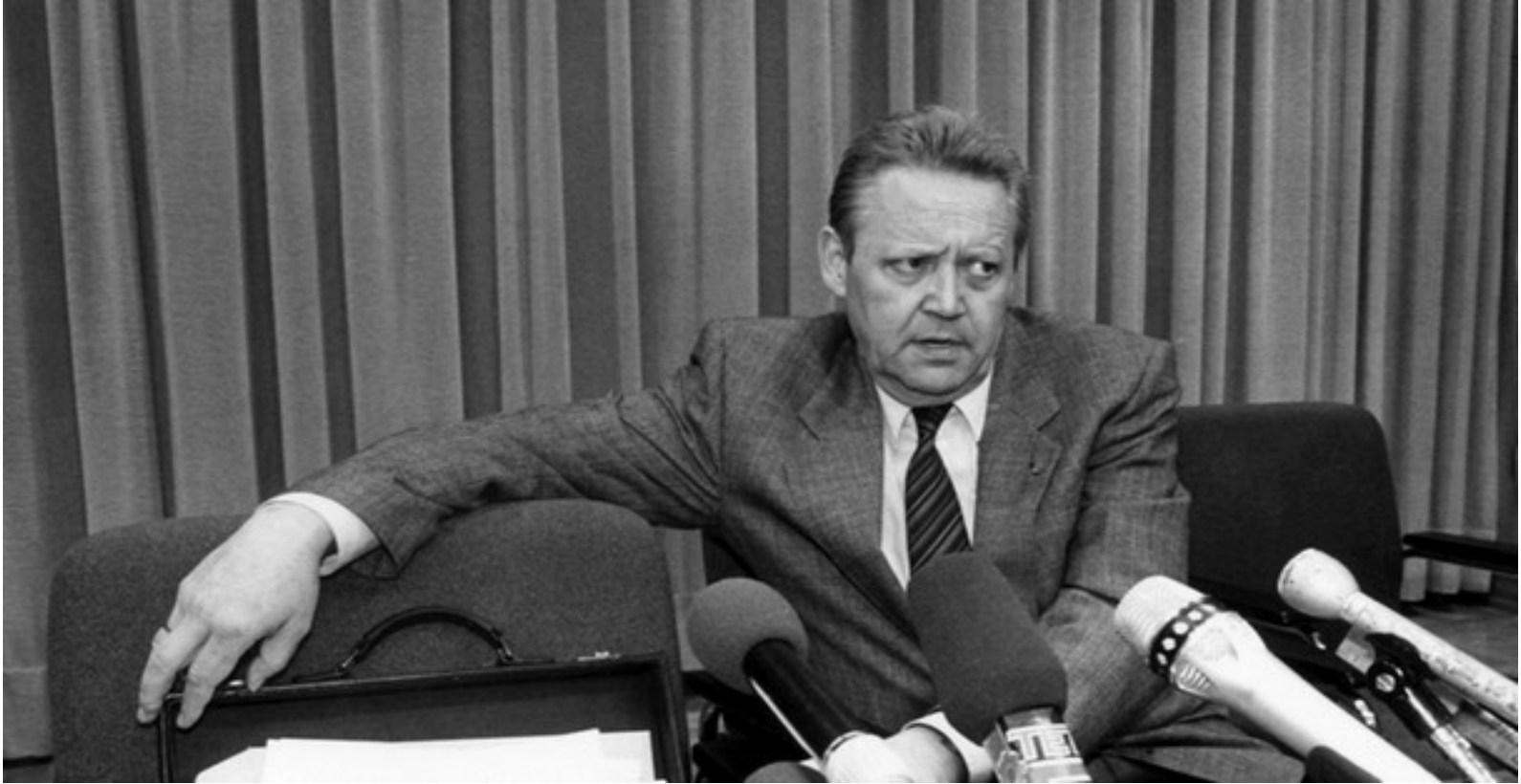
Schabowski bei der Pressekonferenz am 9. November 1989