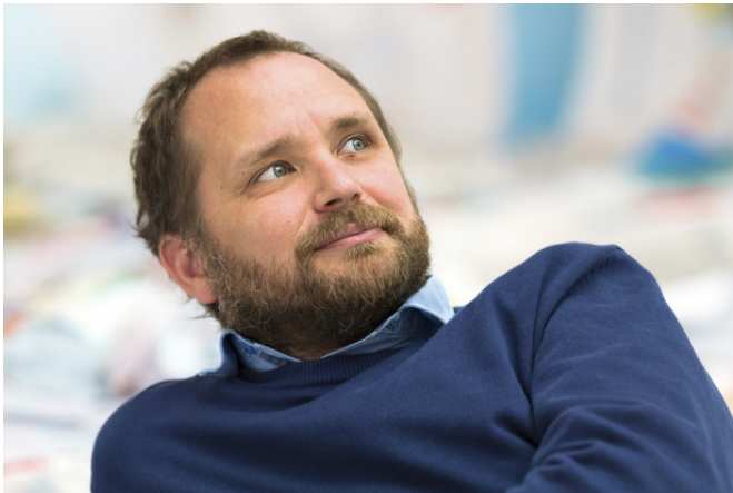
Tomás Saraceno.

การสร้างสรรคงานศิลปะของ โทมัส ซาราเซโน มีต้นแนวคิดมาจากเรื่องราวการเชื่อมศิลปะ วิทยาศาสตร์ชีวิตและสังคมศาสตร์เข้าด้วยกัน ในความพิวพันของจุดเชื่อมโยงต่างๆ ในโลกต่างๆ นี้ ส่งผลต่องานประติมากรรมลอยตัว โปรเจกต์ด้านชุมชน รวมถึงการจัดวางอันสร้างความรู้สึกร่วมของเขาที่นำเสนอความสมานฉันท์ด้านความรู้สึกร่วมของโลกใบนี้ ผ่านนิเวศแห่งการปฏิบัติด้านสังคม ด้านจิตใจและสิ่งแวดล้อม