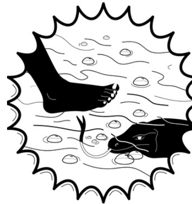
Logo Monitor Lizard House

เพื่อเป็นการตอบโต้ต่อชิ้นงานของ โทมัส ซาราเซโน ผู้คิดค้น Aerocene นั้น ทางมอนิเตอร์ ลิซาร์ด เฮาส์ จะคิดค้นวิธีการจับสัญญาณและสร้างให้เห็นภาพวิฤตด้านภูมิอากาศที่กำลังกัดกร่อนพื้นที่ชายหาดทางตอนใต้ของกรุงเทพมหานคร - สมุทรปราการ