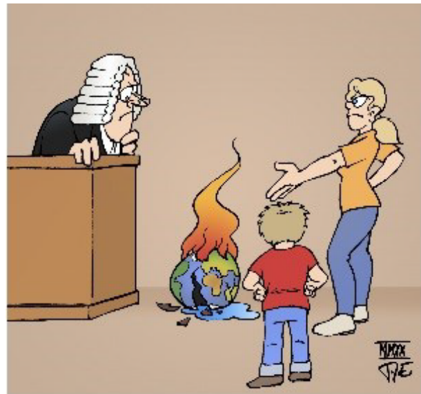
Bildnachweis: Timo Essner/toonpool.com

6 Stellt euch vor, ihr habt bei Fridays for Future mitgemacht. Wählt ein Foto aus und ergänzt einen kurzen Text, wie ihr ihn z. B. bei Instagram schreiben würdet.