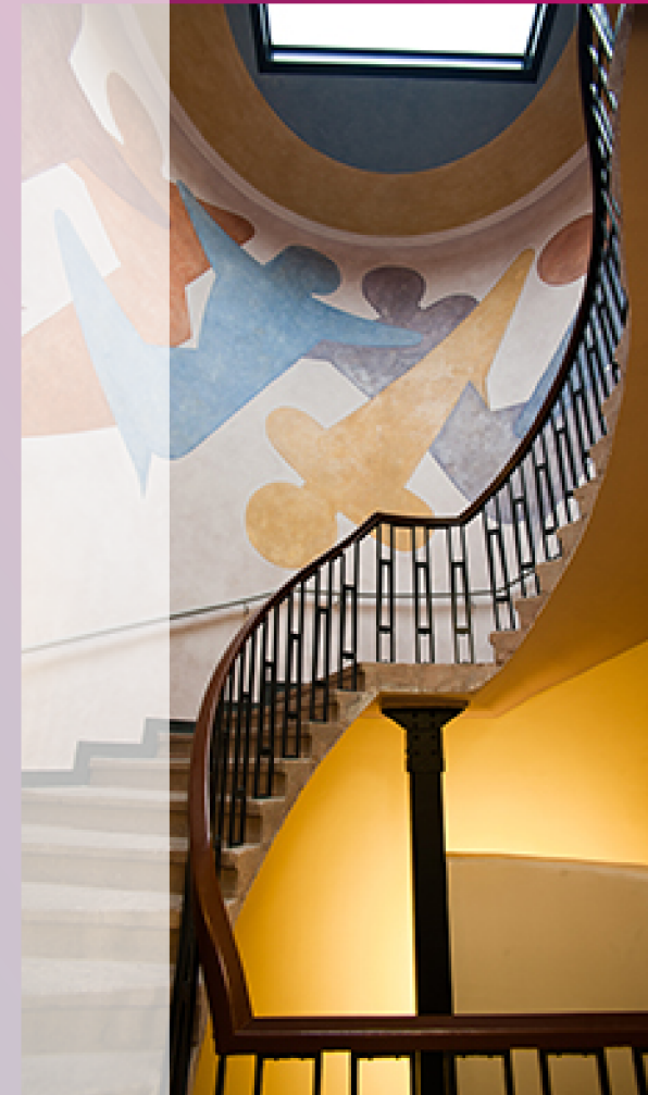
Oskar Schlemmers Figurenfries im Treppenhaus des Van-der-Weide-Baus

Die Umbenennung in Hochschule für Architektur zeigte den Umbau hin zu einer technisch ausgerichteten Ausbildung an.