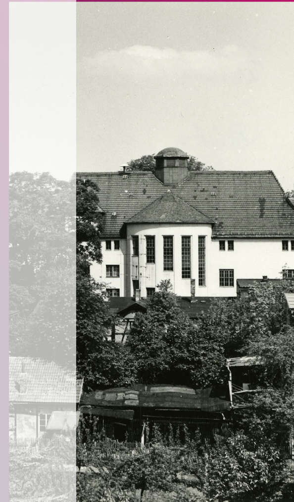
Hintere Ansicht Hauptgebäude, 1985

Walter Gropius gründet das Staatliche Bauhaus Weimar; die avantgardistische Lehre wird unter anderen von Johannes Itten, Lyonel Feininger, Paul Klee und Wassily Kandinsky geprägt.