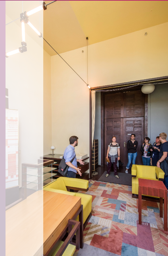
Bauhausspaziergänger im Gropliuszimmer

Gäste können die Bauhaus-Stätten und die Bauhaus-Universität Weimar bei dem von Studierenden geführten Bauhaus-Spaziergang erleben. Die Universität freute sich im Mai 2019 über die 50.000ste Teilnehmerin.