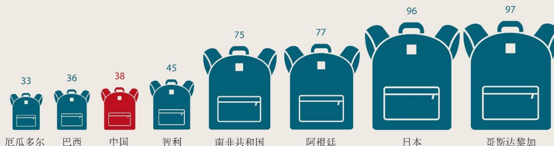
图 2: 长时间在不同国家游学的德国青少年人数（2017/2018学年）