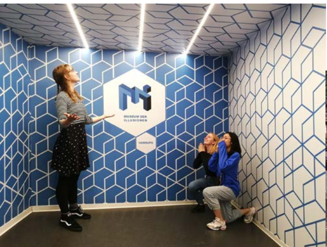
汉堡博物馆, 凤凰古城 Hamburg Museum, Fenghuang