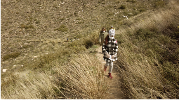
Walk on the mountain, listening