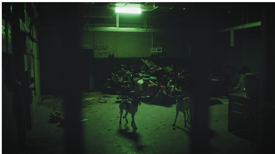
Video stills, The Fear of Leaving the Animal Forever Forgotten under the Ground , 2021