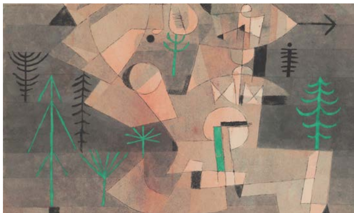
Paul Klee, Garten-Plan (Plan de jardin), 1922, 150. Aquarelle et plume sur papier sur carton ; 26,6 x 33,5 cm. Zentrum Paul Klee, Bern.

Fermeture les 25 décembre et 1 er janvier ♦ Tarifs : 10 € / 7 € / gratuit.