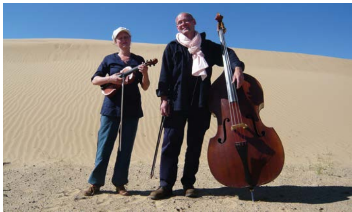
Gottschalk-Jacquemyn © DR

La Malterie. 250 bis boulevard Victor Hugo. Lille