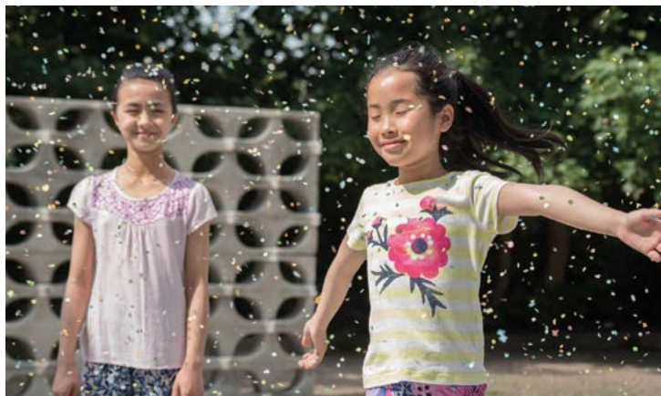
Ente gut - Mädchen allein zuhaus