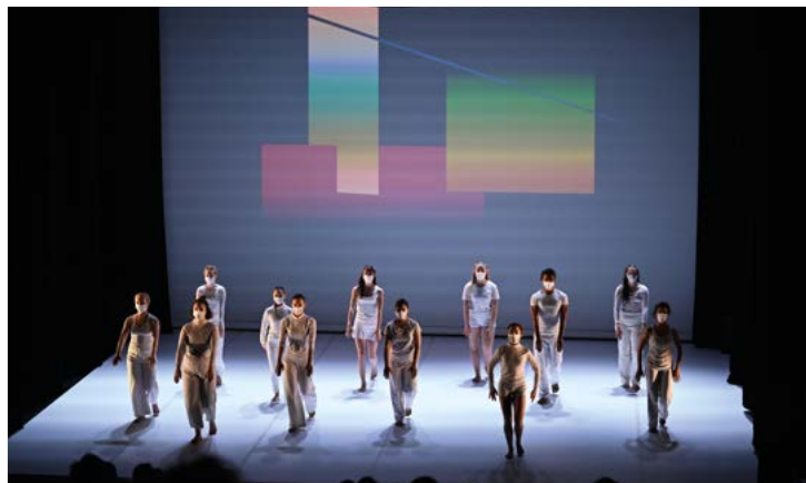
© C e aKoma névé - Isida Micani. Spike

Maison Folie Beaulieu. 33 place Beaulieu. Lomme (lieu à confirmer)