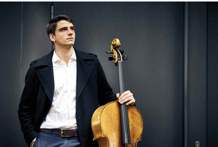
Friedrich Thiele