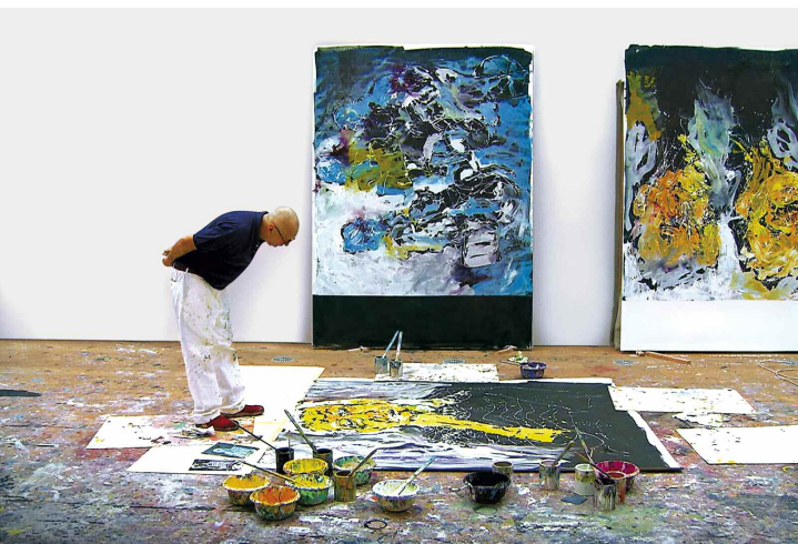
Baselitz (détail)