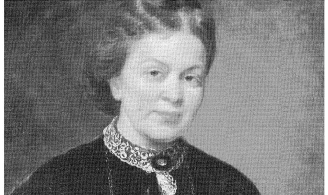
Marie von Ebner-Eschenbach 1830-1916

Die Universität Wien rühmt Marie von Ebner-Eschenbach „als eine der bedeutendsten deutschsprachigen Schriftstellerinnen“ und als „Grande Dame der österreichischen Literatur“.