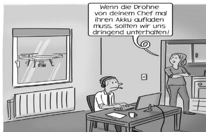
Neulich im Homeoffice