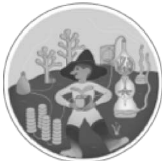
A H 2 O Produzentin

1.1 Die drei Menschen auf den Bildern sind Arbeiter der Zukunft. Was machen sie? Was seht ihr?