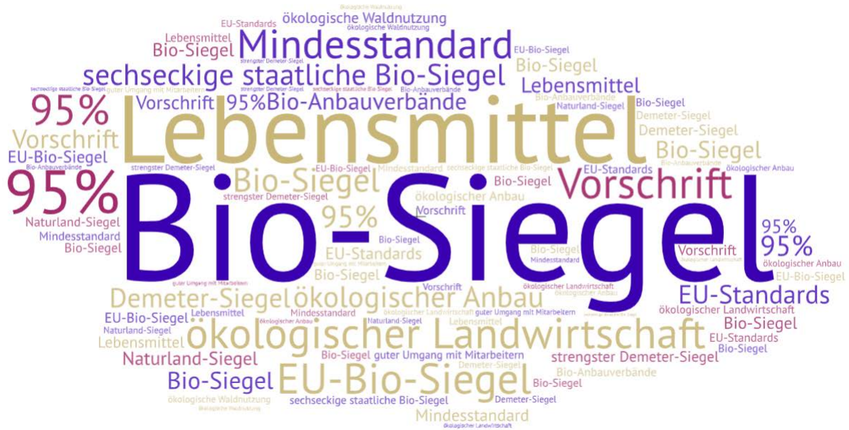
Wortwolke erstellt bei https://wordart.com/create

1a Seht euch die Wortwolke an. Worum geht es in dem Text, den ihr gleich lest? Sprecht zu zweit. Schlagt neue Wörter nach.