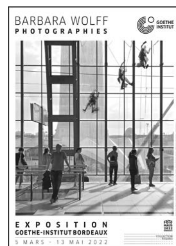
Metropolis #4, S-Bahn Alexanderplatz Berlin, 2018, series "Metropolis"

Barbara Wolff a trouvé les motifs de la série « Amazonia » lors d'une exposition à Belém au Brésil en 2019. Le climat tropical chaud et humide et les conditions environnementales et sociales déterminent la vie des gens.