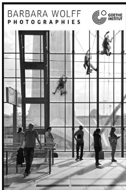
© Barbara Wolff / Collection Regard : Metropolis #4, S-Bahn Alexanderplatz Berlin, 2018

réseau arts plastiques & visuels nouvelle-aquitaine ASTRE