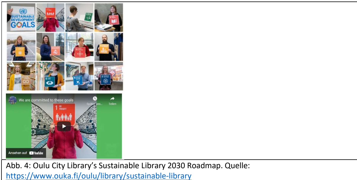
Abb. 4: Oulu City Library's Sustainable Library 2030 Roadmap.

Projekt „Garbage Hero“ aus der Ukraine 86 oder die „Love your Library“ Kampagne der University College Cork (UCC) Library 87 .