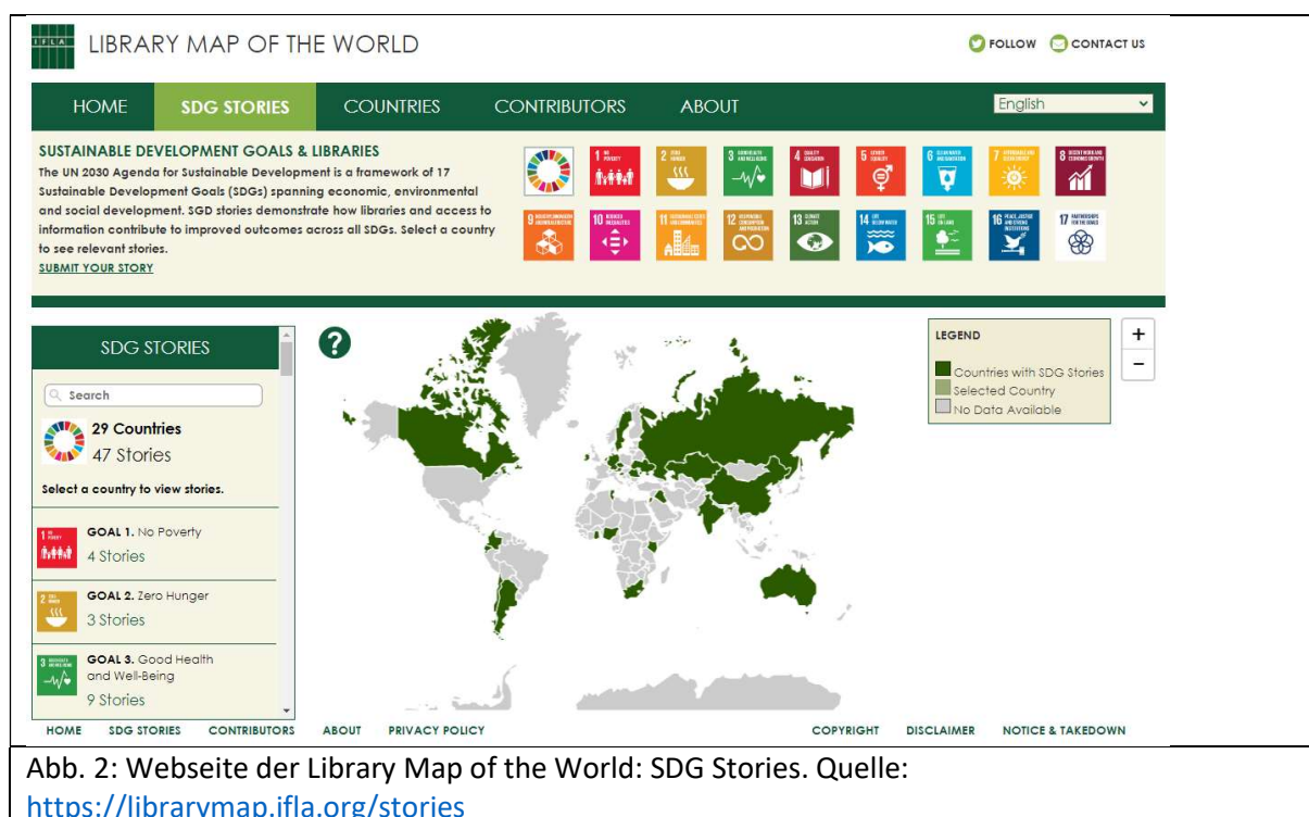
Abb. 2: Webseite der Library Map of the World: SDG Stories.

Die Plattform „Biblio2030“ 26 , eine Initiative der deutschsprachigen Bibliotheksverbände 27 unter Federführung des Deutschen Bibliotheksverbandes, weist ein buntes Allerlei von inzwischen 53 Projekten aus Deutschland, Österreich, der Schweiz und Südtirol (DACHS) nach, die einzelne oder mehrere Agenda-Ziele adressieren. Die Beispiele reichen von einer „Bienenbibliothek“ 28 über verschiedene Upcycling-Projekte, die Einführung von Altenheimbewohnern in die digitale Bibliothekswelt 29 , auch Kooperationen z.B. mit dem NABU – Naturschutzbund Deutschland oder dem Eine-Welt-Laden am Ort 30 , Medienboxen für Flüchtlingsunterkünfte 31 , nachhaltige Veranstaltungen 32 , eine Saatguttauschbörse 33 , OER-Projekte 34 etc. Jedes Beispiel ist mit ein bis zwei Fotos illustriert, SDG-Symbole benennen den Bezug zur Agenda 2030. Im Unterschied zu den SDG Stories der IFLA enthalten die Beispiele keine weiterführenden Informationen, auch Links zu den Webseiten der Bibliotheken werden nicht angeboten, und auch eine Recherche nach bestimmten SDGs oder Orten ist nicht möglich. Dies erschwert eine systematische Recherche sowie eine einfache Kontaktaufnahme zu möglichen Ansprechpartnern, z.B. für Vernetzungen.