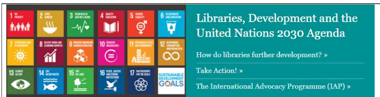
Abb. 1: IFLAs Programm zur Unterstützung der SDGs.

„Take action! Take action now so that libraries have a say. Everyone in the library community and beyond can help promote the role of libraries as supporters of development.“ 14