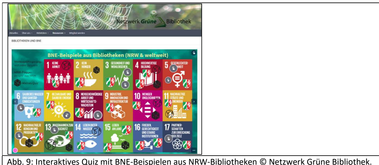
Abb. 9: Interaktives Quiz mit BNE-Beispielen aus NRW-Bibliotheken © Netzwerk Grüne Bibliothek.

Und auch eine Einladung zur aktiven Teilnahme an der Kulturwerkstatt zur Praxis der ökologischen Nachhaltigkeit in niederrheinischen Kunst- und Kulturbetrieben „Kultur macht Klima“ 134 gab Gelegenheit, „draußen“ bibliothekarische SDG-Kompetenz unter Beweis zu stellen. Steter Tropfen höhlt den Stein ... Und wenn wieder einmal die „Deutschen Aktionstage Nachhaltigkeit“ ausgerufen werden, sollten wir dafür sorgen, dass in der offiziellen Publikation des Rats für Nachhaltige Entwicklung auch Bibliotheken mit ihren Aktionen in nennenswerter Zahl in Erscheinung treten! 135