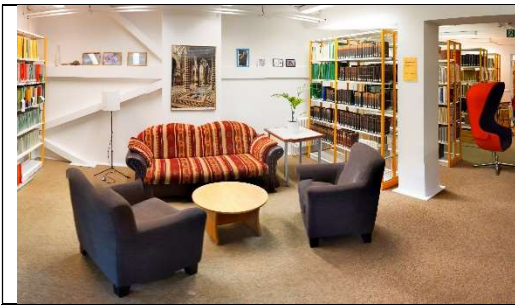
Abb. 8: Nachnutzung von Mobiliar in der Geowissenschaftlichen Bibliothek der FU Berlin.

Fazit: Bibliotheken als Agenten für die Ziele der Agenda 2030: Es gibt Ansätze, aber sie werden kaum nach draußen kommuniziert, eher durch „Mundpropaganda“ und zufällige Hinweise im Kollegenkreis bekannt. Warum stellen Bibliotheken ihr „Licht unter den Scheffel“?