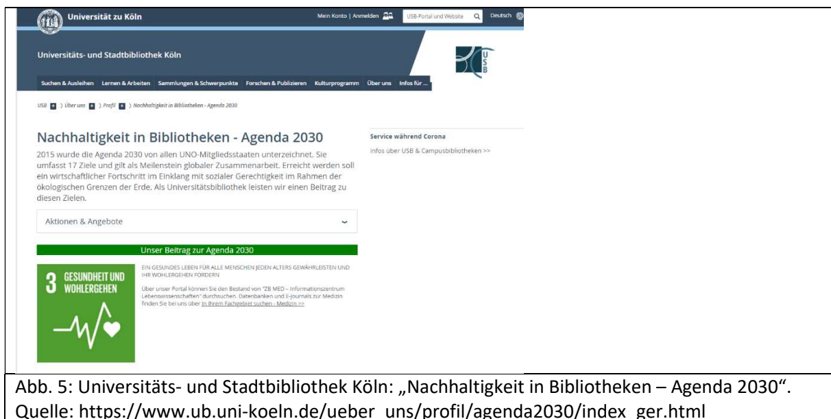
Abb. 5: Universitäts- und Stadtbibliothek Köln: „Nachhaltigkeit in Bibliotheken – Agenda 2030“.

Die Universitäts- und Stadtbibliothek Köln verweist mit ihrer Webseite „Nachhaltigkeit in Bibliotheken – Agenda 2030“ auf die SDGs und benennt als „Unser[en] Beitrag zur Agenda 2030“ ausdrücklich unter Verwendung der SDG-Symbole die Nachhaltigkeitsziele 3: Gesundheit und Wohlergehen, 4: Hochwertige Bildung, 9: Industrie, Innovation und Infrastruktur, 10: Weniger Ungleichheiten, 11: Nachhaltige Städte und Gemeinden sowie 12: Verantwortungsvoller Konsum- und Produktionsmuster. Jedem SDG sind Beschreibungen der jeweils entsprechenden Umsetzung beigelegt. Unter der Rubrik „Aktionen und Angebote“ werden zudem konkrete Aktionen wie eine Kronkorkensammlung für einen sozialen Zweck vorgestellt. 114