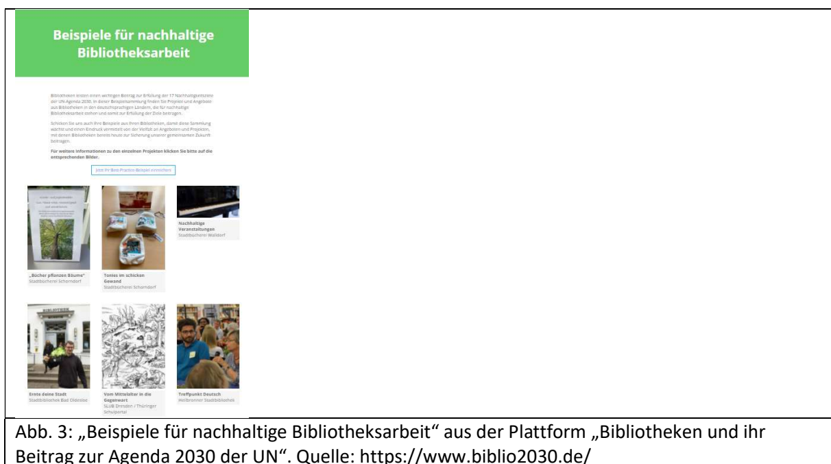
Abb. 3: „Beispiele für nachhaltige Bibliotheksarbeit“ aus der Plattform „Bibliotheken und ihr Beitrag zur Agenda 2030 der UN“.

Es geht bei dieser Plattform also nicht darum, neue und zusätzliche Projekte zu entwickeln, sondern (wem gegenüber?) sichtbar zu machen, was Bibliotheken bereits zur Agenda 2030 beitragen, ohne dass sie selbst dies schon als erklärtes Ziel im Sinne der Agenda geplant hätten. Auf den Webseiten der Bibliotheken lässt sich in der Regel kein Bezug ihrer Aktivitäten zur Agenda-2030 finden. Offenbar ist dies nicht Voraussetzung für die Aufnahme in die Beispielsammlung. Ein Sichtbarmachen der Bibliotheken als Botschafter der Agenda, als „Exemplars, Educators, Enablers“ gegenüber der Öffentlichkeit, gegenüber ihrer eigenen Community im Sinne der IFLA ist damit nicht gegeben. 36