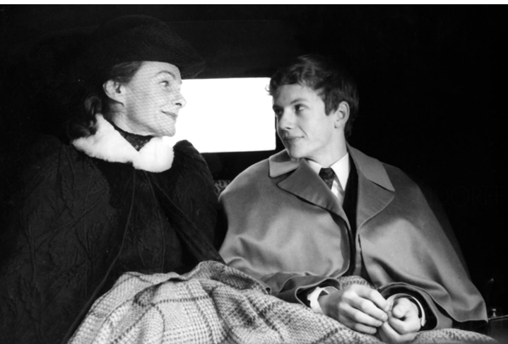
Der junge Törless © Gaumont / DFF Sammlung Volker Schlöndorff, Karl Reiter