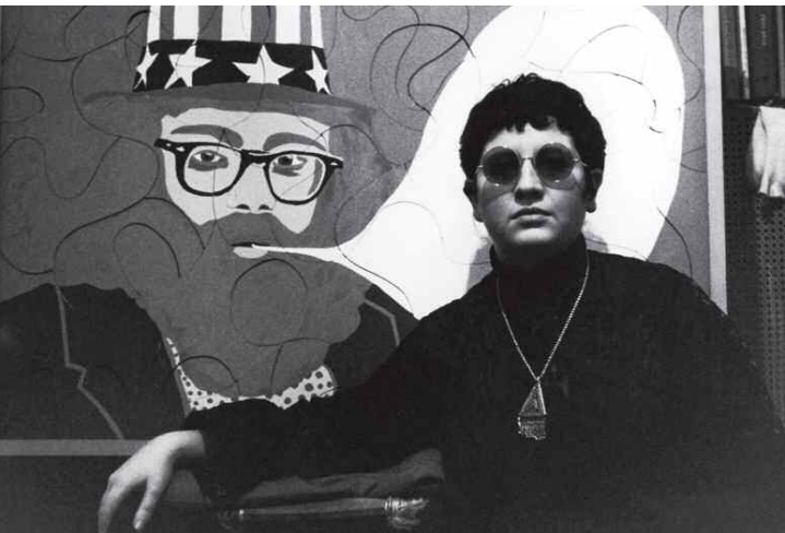
Paris Calligrammes © Ulrike Ottinger