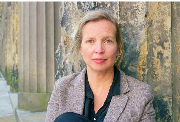
Jenny Erpenbeck