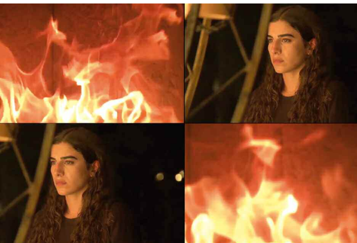
Paradise Still © Leyla Yenirce

Les créations vidéo, installations et performances de Leyla Yenirce (née en 1992) abordent des angles et des thèmes multidimensionnels de la culture kurde et yézidie tout comme de sa propre identité.