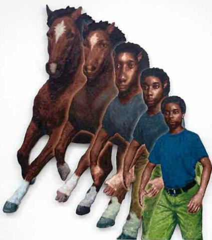
Tell Me, We Both Matter Don't We, 2021

Depuis 1953, le cercle culturel de l'économie allemande au sein de la Fédération des Industries allemandes (BDI) décerne chaque année le Prix ars viva . Dédié aux arts plastiques, il récompense l'excellence de jeunes artistes vivant en Allemagne. Georg Baselitz, Katharina Sieverding, Albert Oehlen, Rosemarie Trockel, Candida Höfer, Thomas Ruff, Wolfgang Tillmanns ou encore Thomas Struth figurent parmi les plus de 350 lauréat-e-s des sept dernières décennies.