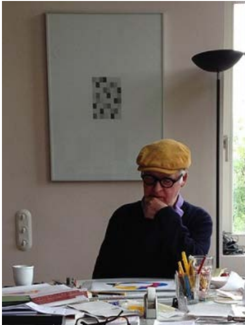
Ulrich Rückriem (2017)