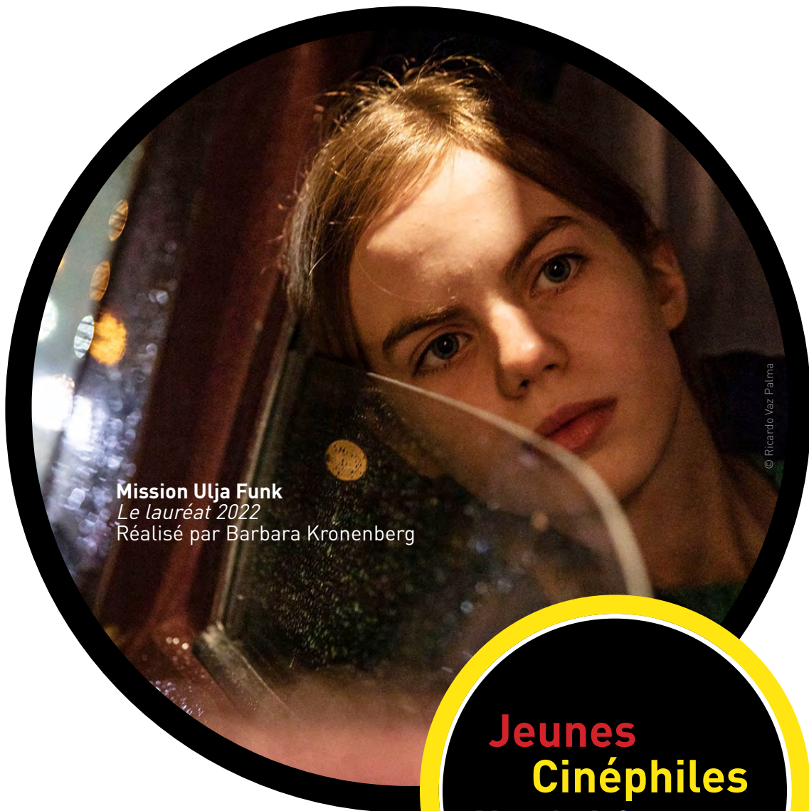
Mission Ulja Funk Le lauréat 2022 Réalisé par Barbara Kronenberg