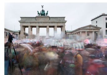
Women's march, Berlin (12.27 - 12.39 Uhr, 21.1.2017)