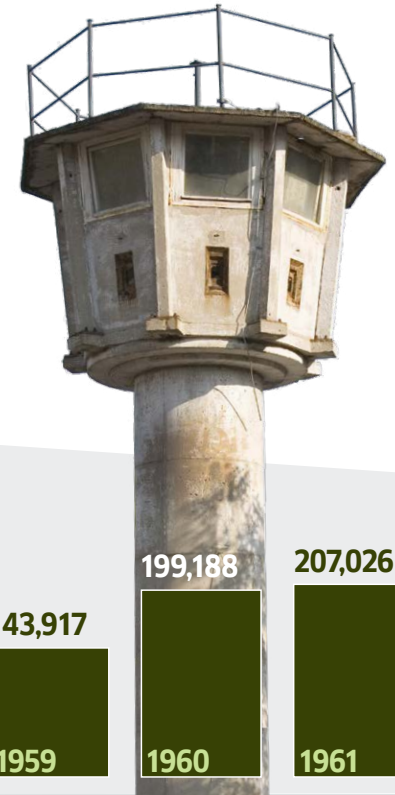
Emigration 1949-1961 from East Germany to West Germany

2d Die Statistik endet 1961. Weit du warum?