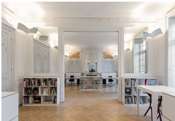
1 © Émilie Goa