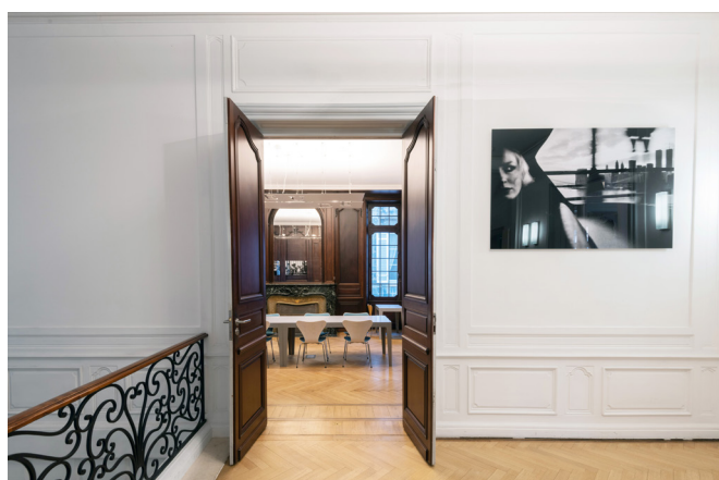
6 © Émilie Goa