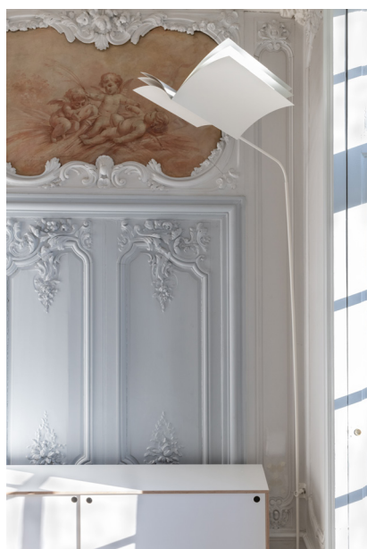
4 © Émilie Goa