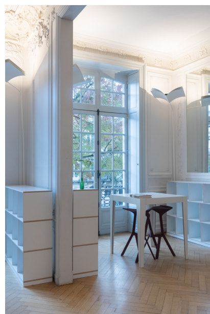
5 © Émilie Goa