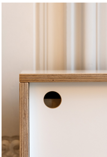
3 © Émilie Goa