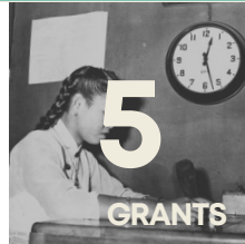
Photo series in response to a series in the archive. Minimum 10 image - 500 Euro

Films of any kind of narrative from a series of images. Minimum length 3 minutes - 500 Euro