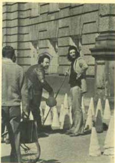
‘Η τέχνη στο δρόμο; L'art dans la rue? Strassenkunst?

οι τελευταίες αυτές, περισσότερο και πολύ βαθύτερα από κάθε άλλο, έχουν άφο- μοιωθεί στο σύστημα της σημερινής αγοράς. 'Η κατάσταση αυτή έχει σαν αποτέλεσμα τη δυνατότητα έκλογής μέσα στη σωρεία των προτεινομένων μορφών, αλλά όσο ο καλλιτέχνης δεν έχει ακόμα απελευθερωθεί από την άστυχή του υπόσταση, δεν μπορεί νά γίνει λόγος για ελεύθερη και ένσυνεί- δητη έκλογή.