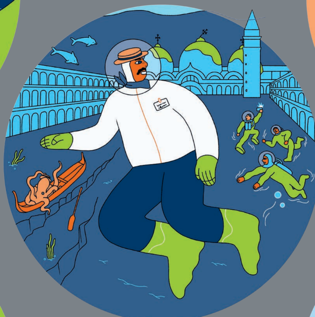
Tauchführer*in in Venedig