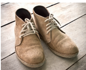
die Schuhe (pl.)