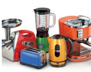
die Haushaltsgeräte (pl.)