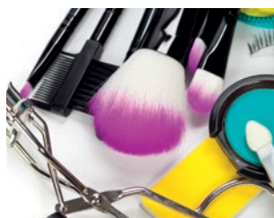
die Kosmetikprodukte (pl.)