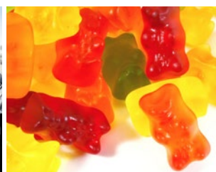
die Gummibärchen (pl.)