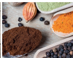
die Gewürze (pl.)