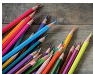
die Buntstifte (pl.)