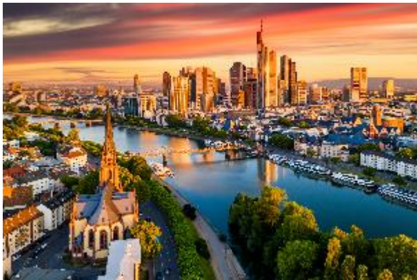
Frankfurt ist schön.