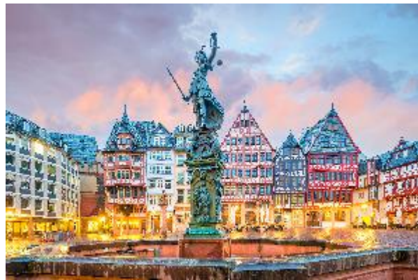
Frankfurt ist interessant.