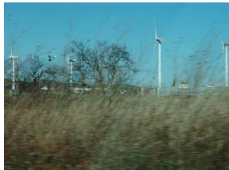
wind - _____