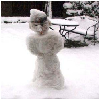
snow - _____

Kopiervorlage 6: Wetterwörter zuordnen (Deutsch nach Englisch)