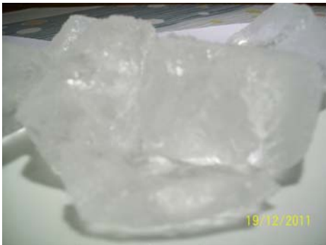
ice - _____