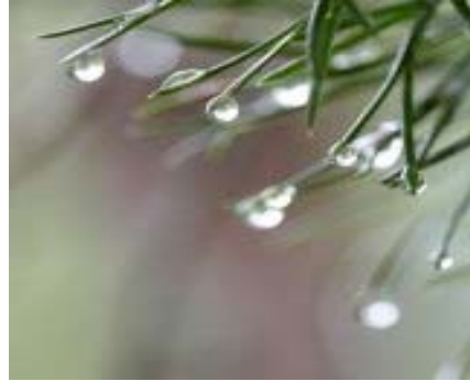
rain - _____