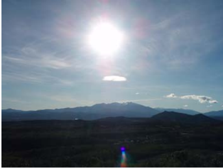
sun - _____