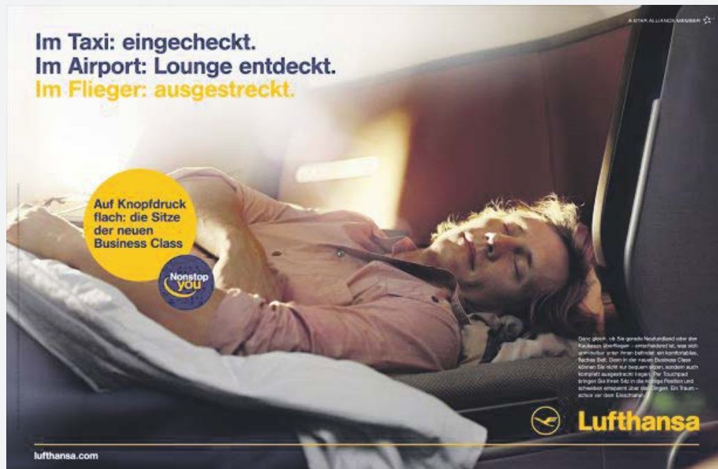
Anzeige 3: Lufthansa