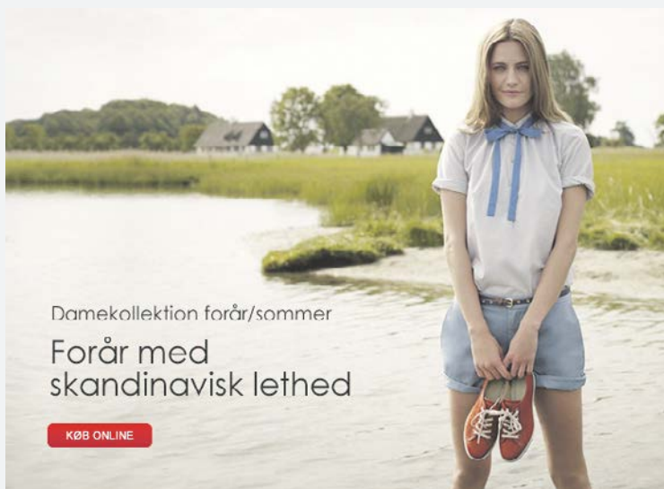
Anzeige 1: Ecco