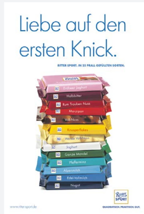
Anzeige 2: Ritter Sport