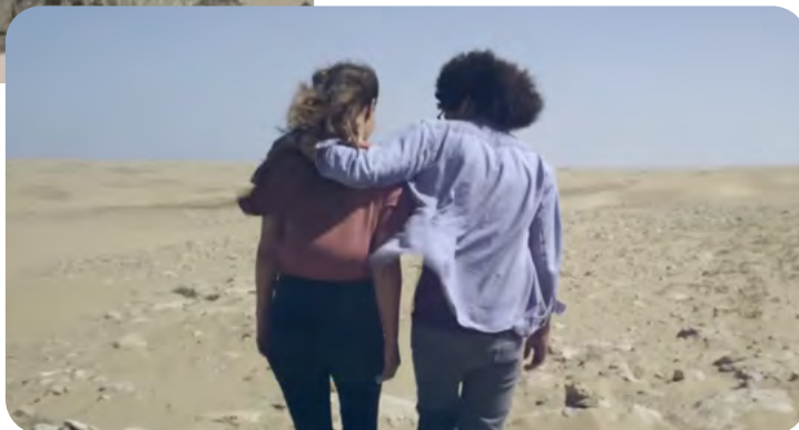
Namika: Lieblingmensch