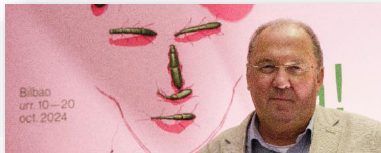
Reiner Stach delante del Photocall del Festival JA!

Nuestro invitado conversó con la escritora Berta Vias Mahou en un auditorio rebotante de público acerca de las facetas más luminosas de la vida de Franz Kafka.