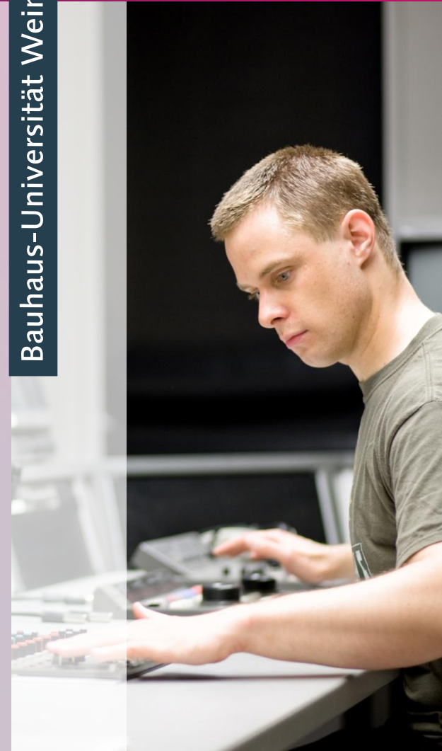
Studierender im Labor