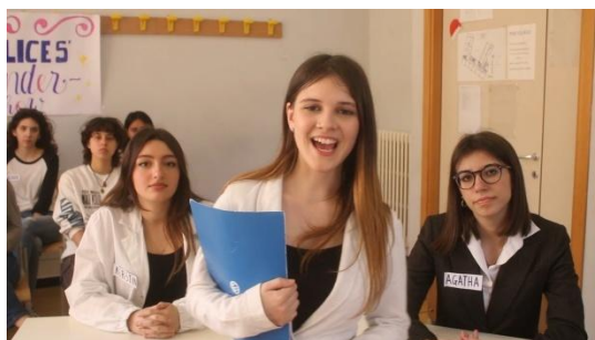
Schüler*innen des Liceo Da Vigo Nicoloso, Rapallo © Goethe-Institut Italien – Video s. Projektseite Kat. PROFESS. 2024