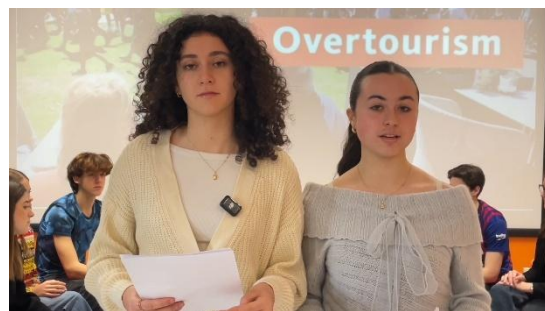
Schüler*innen des Liceo Scipione Maffei, Verona © Goethe-Institut Italien – Video s. Webseite Kat. LIGHT 2025