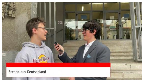
Schüler*innen des Liceo Francesco Petrarca, Triest – Video s. Webseite Kat. PROFESS. 2024

Dauer von Talk professional : ca. 15 Minuten