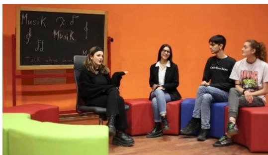
Schüler*innen des IIS Des Ambrois, Oulx – Video s. Webseite Kat. LIGHT 2024