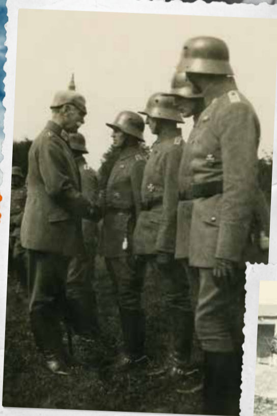
Remise de la Croix de fer à Gottfried Fuchs par le grand-duc de Bade, mars 1917.

Il est démobilisé de son régiment le 30 novembre 1918 et rentre chez lui à Karlsruhe. Les horreurs dont il est témoin au front le marquent de manière indélébile. Le fait d'avoir vu la souffrance et la cruauté de près façonne profondément sa vision du monde, lui insufflant une conscience lucide de la nature humaine et renforçant sa conviction qu'il faut rester fidèle aux valeurs morales, même – et surtout – lorsque les circonstances incitent les gens à les ignorer ou à les abandonner.