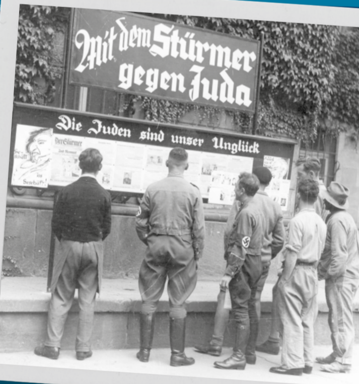
Passants devant une vitrine du journal « Der Stürmer » présentant la propagande nazie antisémite, 1935.

5. Inländische Vermögenswerte: siehe Anlage. (Art der Vermögenswerte und deren ungefähre ziffernmäßiger Wert ist anzugeben, ferner Angabe, ob bereits Sicherstellung der Vermögenswerte erfolgt ist.)