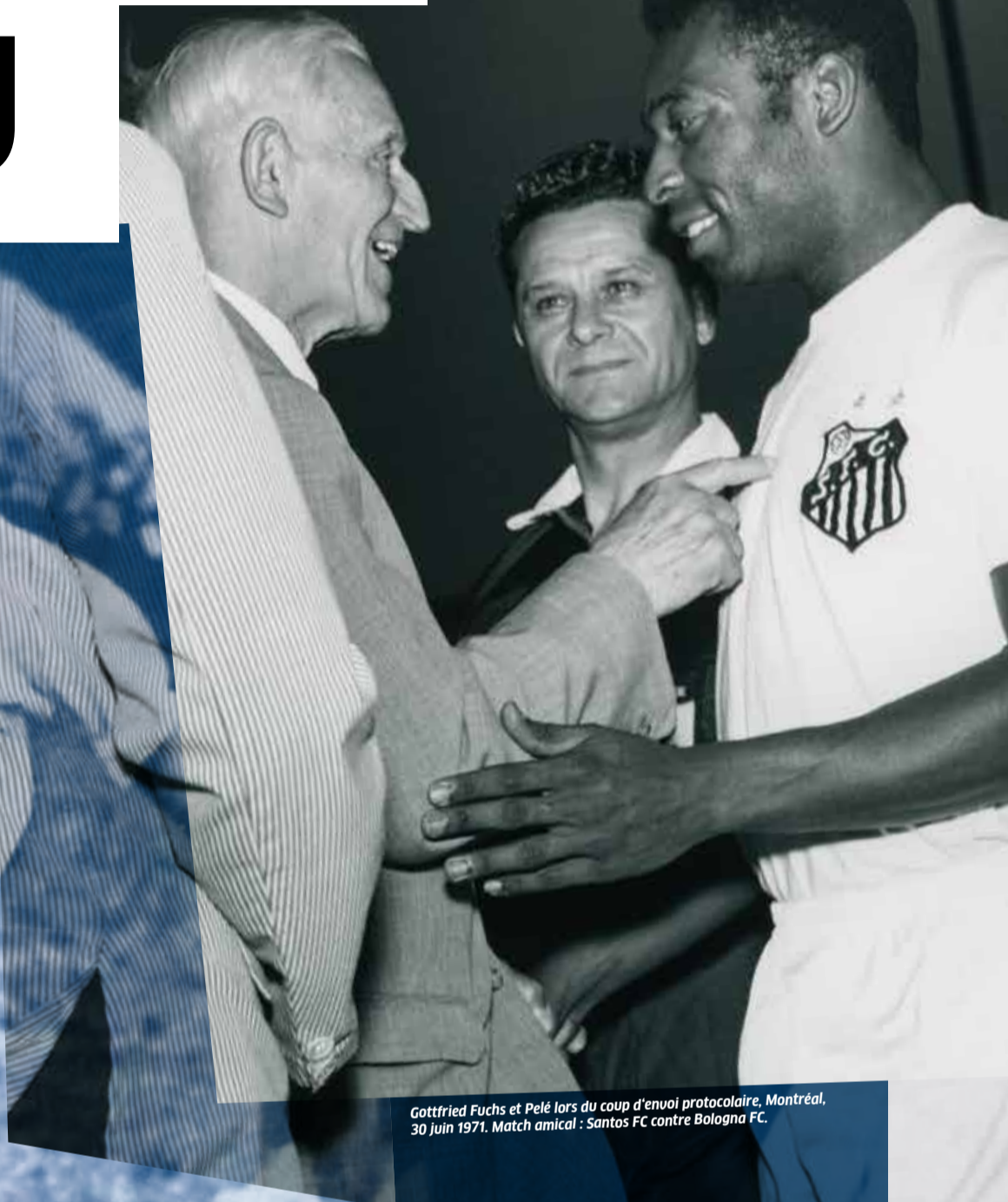
Gottfried Fuchs et Pelé lors du coup d'envoi protocolaire, Montréal, 30 juin 1971. Match amical : Santos FC contre Bologna FC.