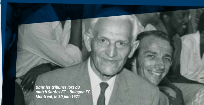
Dans les tribunes lors du match Santos FC - Bologna FC, Montréal, le 30 juin 1971.

... Il n'en reste pas moins un devoir humain pour nous tous de ne rien reprocher à personne - et certainement pas à la nouvelle génération. »