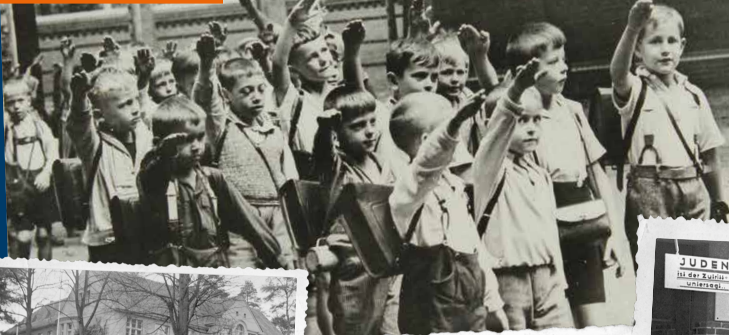
Une classe d'école primaire et leur enseignante effectuent le salut nazi obligatoire dans une cour d'école en Allemagne, vers 1933.