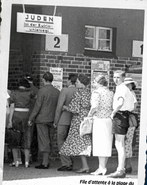
File d'attente à la plage du Wannsee avec le panneau : « Entrée interdite aux Juifs », 1935.