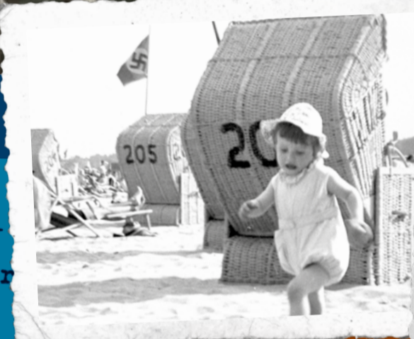
La plage du Wannsee avec des drapeaux nazis, Berlin, 1936.