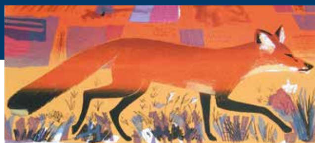
En-tête du bulletin d'information de la famille Fuchs.