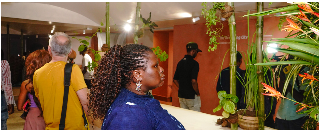
The Breathing City par MatriAér Lab, 2026, (Center for Contemporary Art Lagos - Lagos, Nigeria)