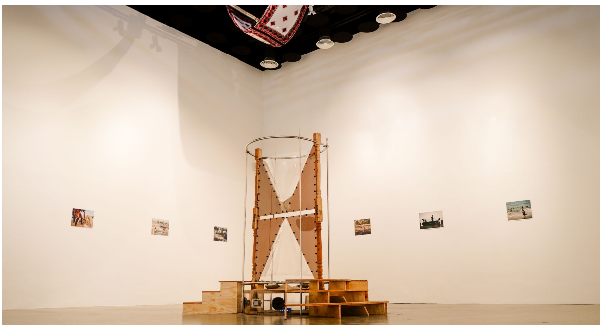
Sands of Time par le collectif Nigérian Ala Praxis, 2025, (Tiwani Contemporary Lagos - Lagos, Nigeria)

En 2026, le projet s'étendra au-delà de Lagos (Nigeria) pour intégrer des idées, des stratégies et des enseignements provenant de différents pôles à travers le continent africain, afin de faciliter le transfert de connaissances interdisciplinaire.