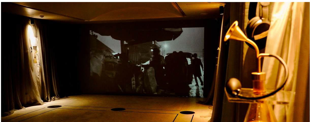
La ville répond : Taruwa City par Sarauniya Ènè, 2026, (Center for Contemporary Art Lagos - Lagos, Nigeria)