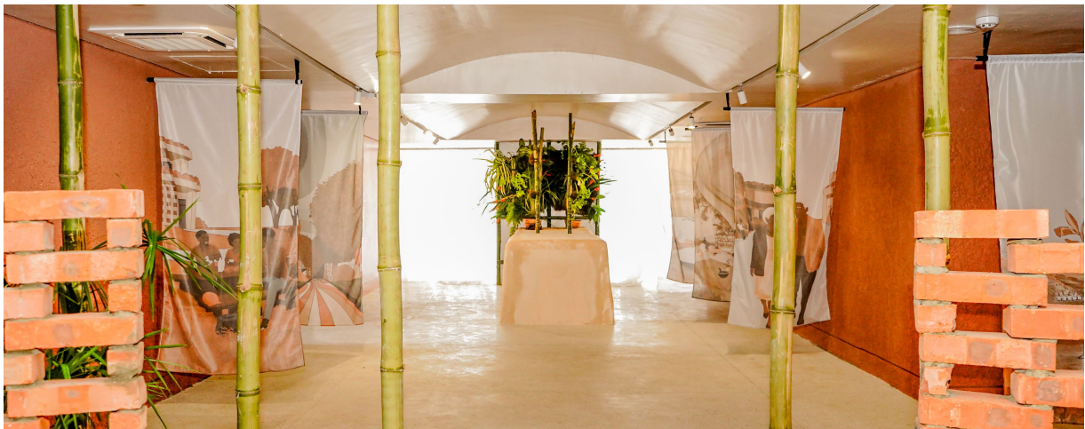
The Breathing City par MatriAér Lab, 2026, (Center for Contemporary Art Lagos - Lagos, Nigeria)