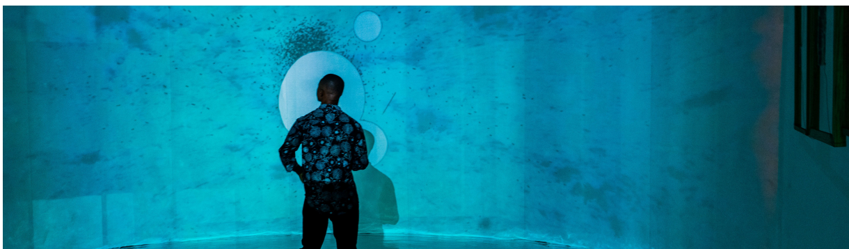
Know Thy Self par The Source Code, 2024, (Old Nigerian Printing Press - Lagos Nigeria)