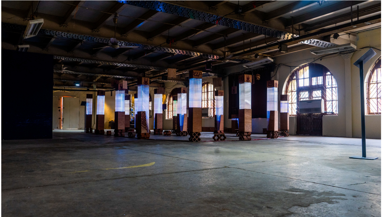
Initiative de Chronoverse, 2024, (Old Nigerian Printing Press - Lagos, Nigeria)

Dreaming New Worlds mesure son succès à sa capacité à produire des propositions culturelles concrètes pouvant être testées, débattues et mises en œuvre. Les collectifs sélectionnés sont appelés à contribuer aux résultats suivants: