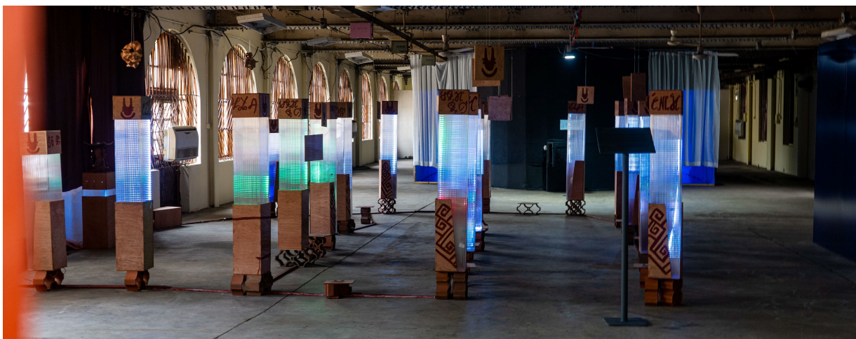
Lancé par Chronoverse, 2024, (Old Nigerian Printing Press - Lagos, Nigeria)