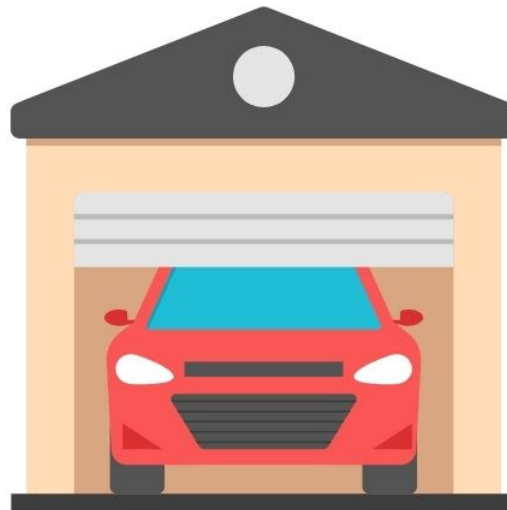
in der Garage