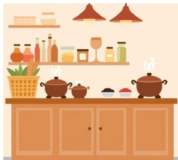
in der Küche

Pumuckl wohnt in der _____ von Meister Eder.