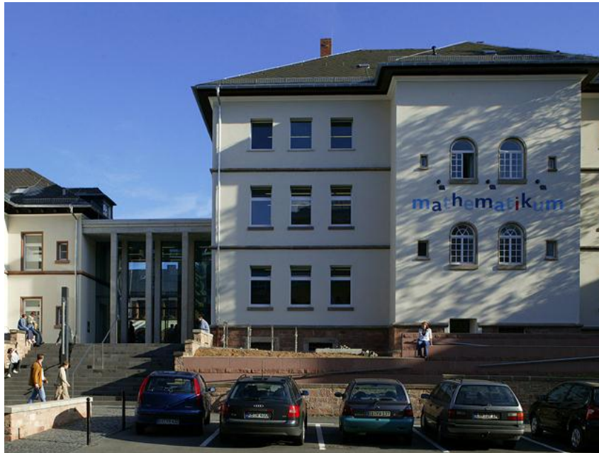
Mathematikum Giessen