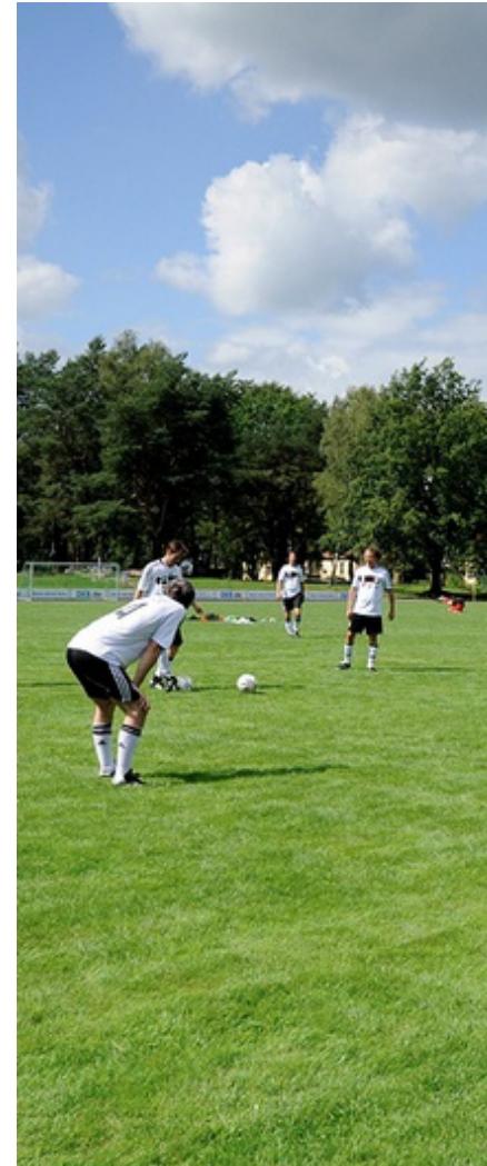
L'Équipe nationale allemande des Auteurs

À L'OCCASION DU CHAMPIONNAT D'EUROPE DE FOOTBALL 2016