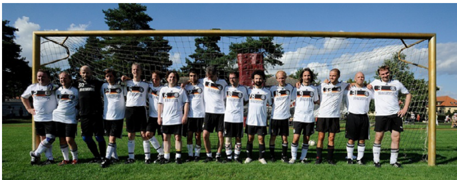
L'Équipe nationale allemande des Auteurs