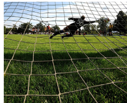
L'Équipe nationale allemande des Auteurs