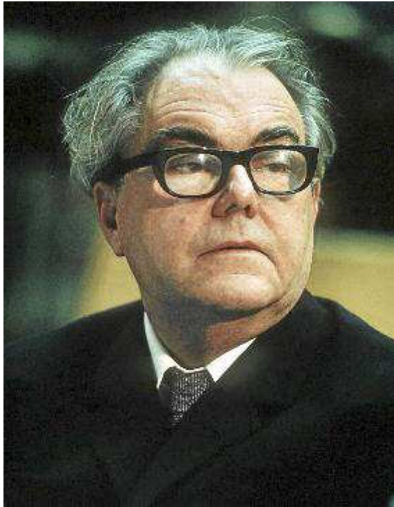
Imagen del autor suizo Max Frisch

nivel global cuya influencia pervive sobre sucesivas generaciones de escritores.