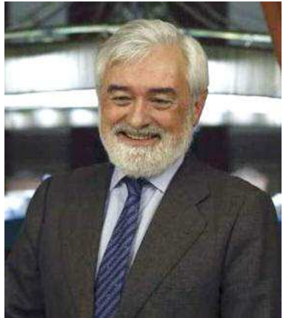
Turia publicará una entrevista con el presidente de la RAE, Darío Villanueva