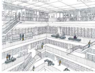
STADTBIBLIOTHEK AM MAILÄNDER PLATZ, STUTTGART 슈투트가르트 시립도서관 (일라노 공경에 위하)