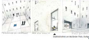
Stadtbibliothek am Mailänder Platz, Stuttgart