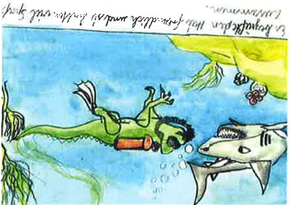
8. Es begrüßt den Hai freundlich und sie hatten viel Spaß zusammen.