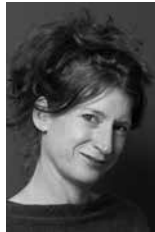
Felicitas Willems Produksiyon Menajeri