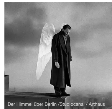
Der Himmel über Berlin / Studiocanal / Arthaus